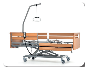
Optional mit geteilten Seitengitter Buche